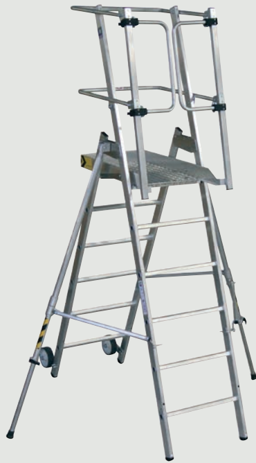
Standardversion FlexxStep, Bestell-Nr. 52526