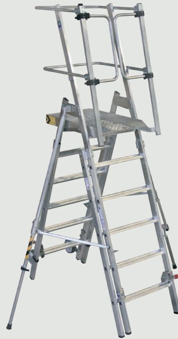
FlexxStep mit Teleskopaufsatz, Bestell-Nr. 52538