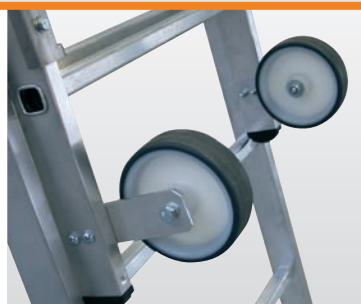
Einfacher Transport durch Rollen Ø 150 mm