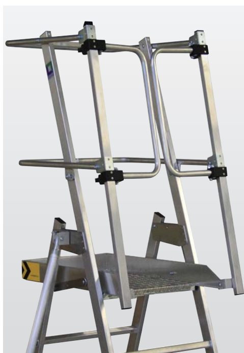
Rundum geschützt durch stabiles Geländer und Knieleiste