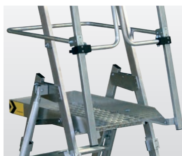
Stabile Plattform aus Aluminium