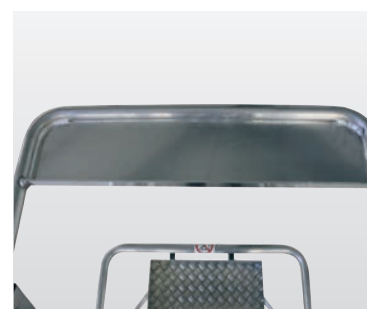
Großzügige Ablageschale für Werkzeuge usw.