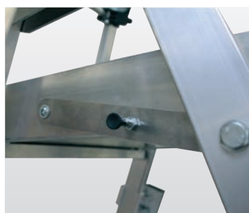
Die Plattformarretierung verhindert unbeabsichtigtes Zusammenklappen