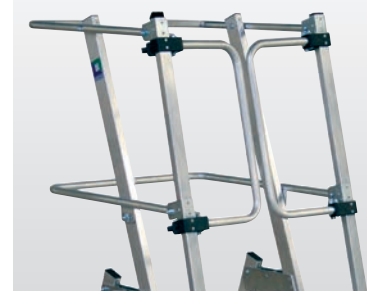
Komfortabler Zugang durch selbstöffnende Sicherheitstür