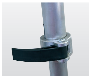
Passend für alle Untergründe durch stufenlos verstellbare Ausleger mit Schnellverschluss