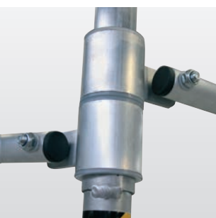
Gleitgelagerte, sichere Führung der Ausleger